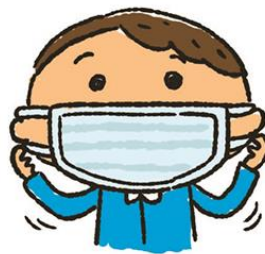
ゴムひもを耳にかける