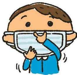
鼻と口の両方を 確実に覆う

くしゃみや咳が出ている間はマスクを着用し、使用後のマスクは放置せず、ごみ箱に捨てましょう。マスクを着用していても鼻の部分に隙間があったり、あごの部分が出たりしていると効果がありません。鼻と口の両方を確実に覆い、正しい方法で着用しましょう。