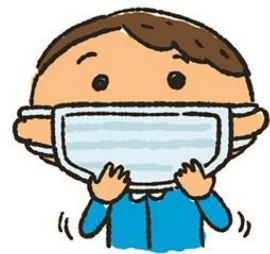
隙間がないよう 鼻まで覆う