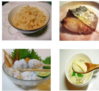
＜爽やかでいいですね＞